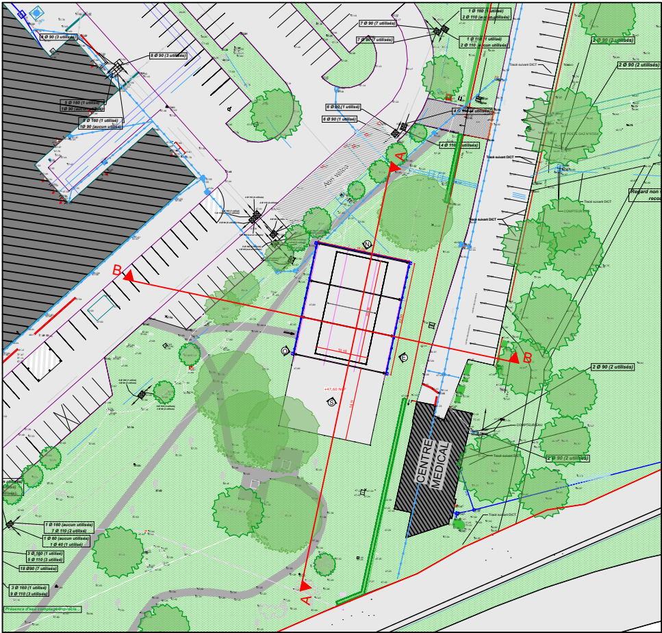
Plan de repérage 1:1000